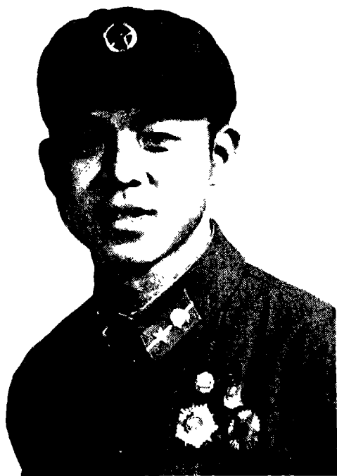
雷 锋 同 志 像